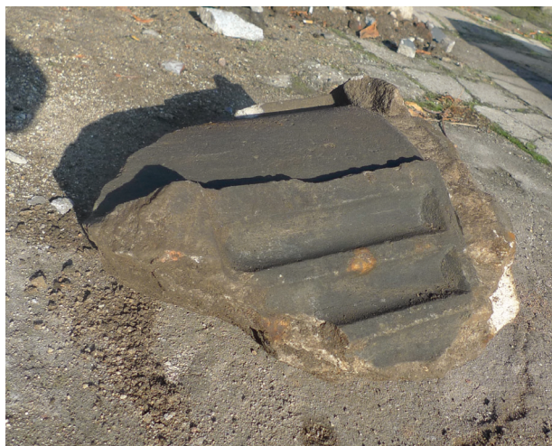
Il. 2. Detal architektoniczny filaru