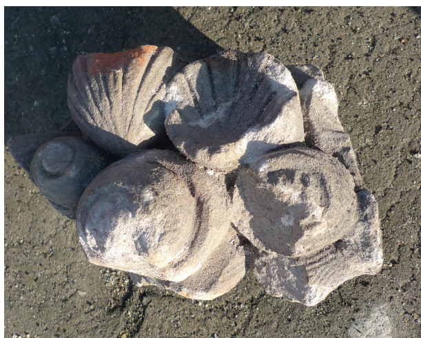
Il. 4. Fragment ornamentu muszlowego