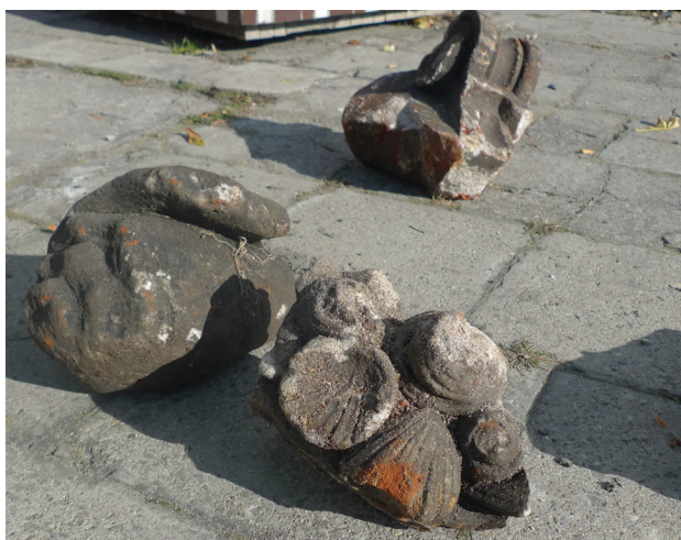
Il. 3. Ornamenty muszlowe i fragment filaru