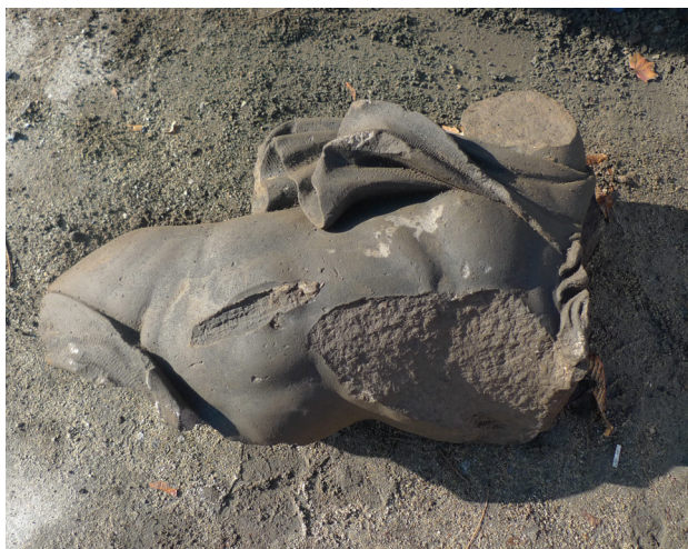
Il. 1. Tors postaci Neptuna