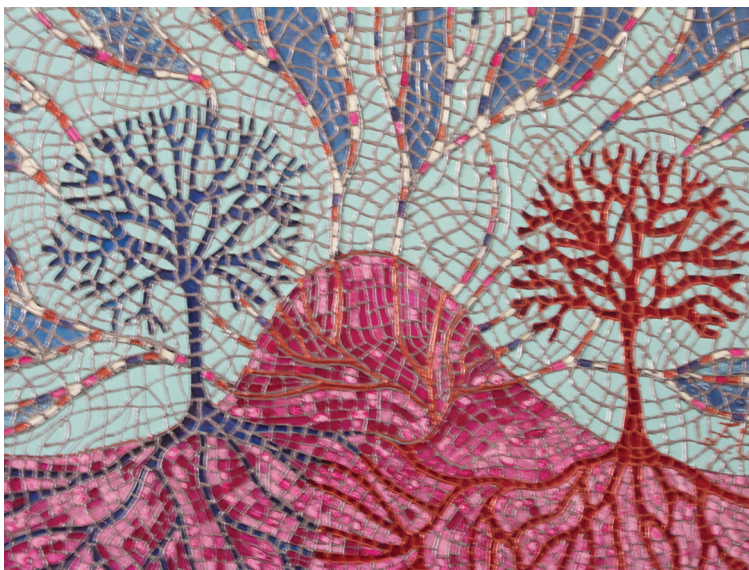
Kontakt, mozaika szklana, autor Ewa Cisek Contact, glass mosaic by Ewa Cisek