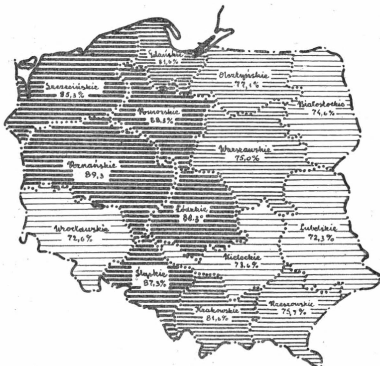
Stopień spłat należności z tytułu Daniny Narodowej wg województw na dzień 30.4.1947 r.

W rekordowym tempie 2 miesiące czy to o dużej sprawności aparatu dokonano wymiaru daniny w skarbowego i komunalnego, który stosunku do 4.403.982 płatników na współdziałając z komisjami obywa-