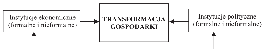
Rys. 2. Wpływ instytucji na przeobrażenia gospodarcze