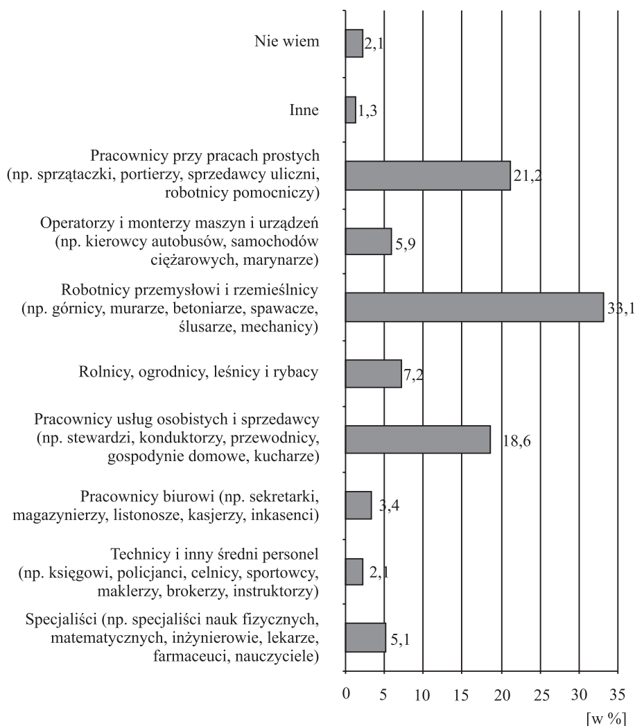
Rys. 1. Zawody, w jakich pracują Podlasianie na emigracji zarobkowej

ramach edukacji szkolnej. Dłuższe wykonywanie takiej pracy może doprowadzić do dewaluacji zdobytej wcześniej wiedzy. Potwierdzenie tej tezy znajduje odzwierciedlenie w danych wskazujących na relacje między kwalifikacjami emigrantów a wykonywana pracą. Z informacji tych wynika, że 46,6% respondentów wykonuje pracę poniżej kwalifikacji, wiedzy, umiejętności, jakie nabyli w swoim życiu zawodowym. Natomiast 43,2% emigrantów jest zatrudnionych zgodnie ze swoim przygotowaniem zawodowym.