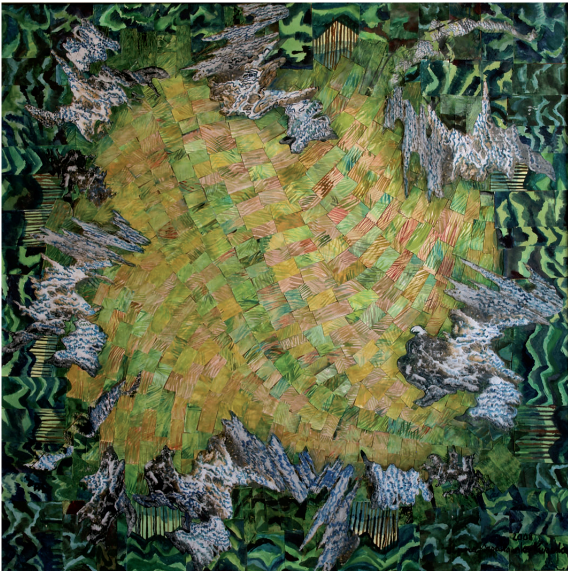
„Droga do środka 8” kolaż, 90 × 90 cm – 2010