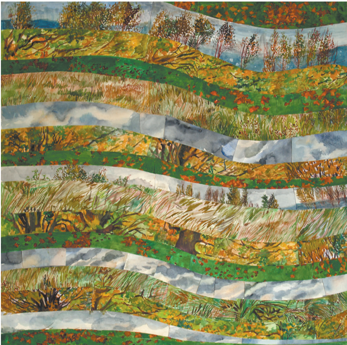
„Droga do środka 10” kolaż, 90 x 90 cm – 2010