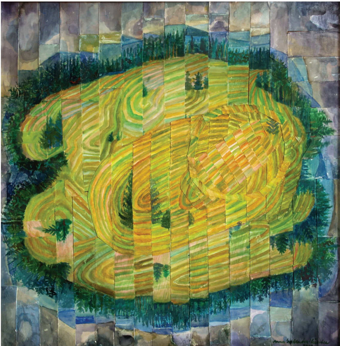
„Droga do środka 4” kolaż, 90 × 90 cm – 2008