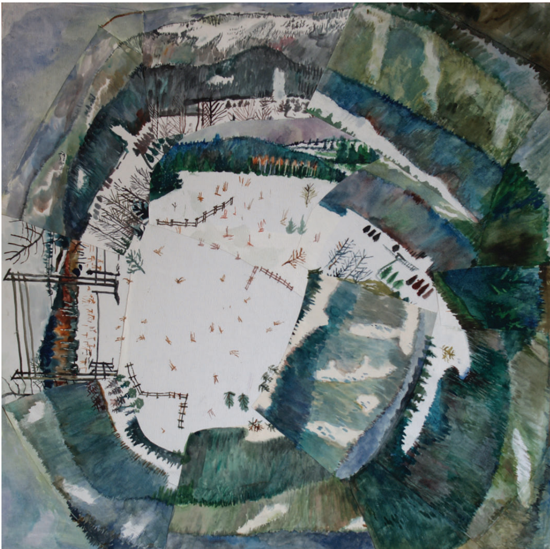
„Droga do środka 5” kolaż, 90 x 90 cm – 2009