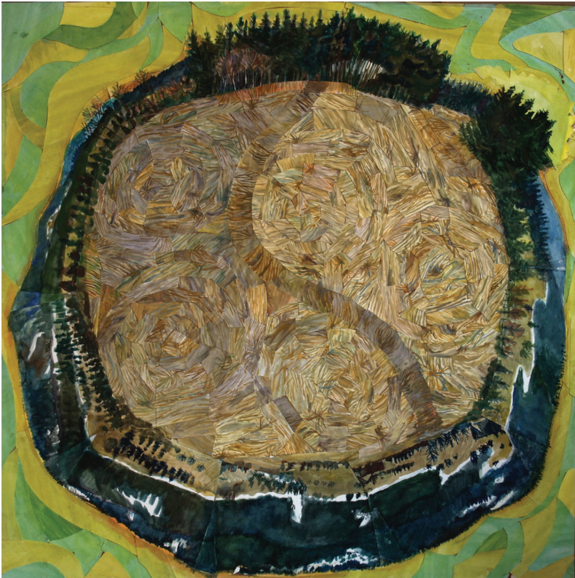
„Droga do środka 14” kolaż, 90 × 90 cm – 2010