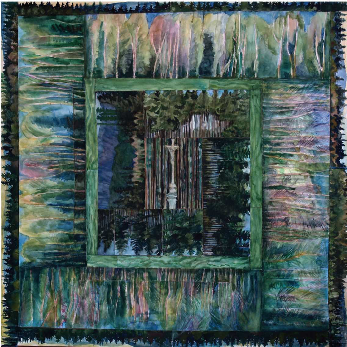
„Droga do środka 18” kolaż, 90 x 90 cm – 2011