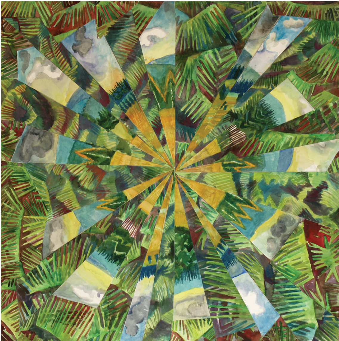
„Droga do środka 7” kolaż, 90 x 90 cm – 2009