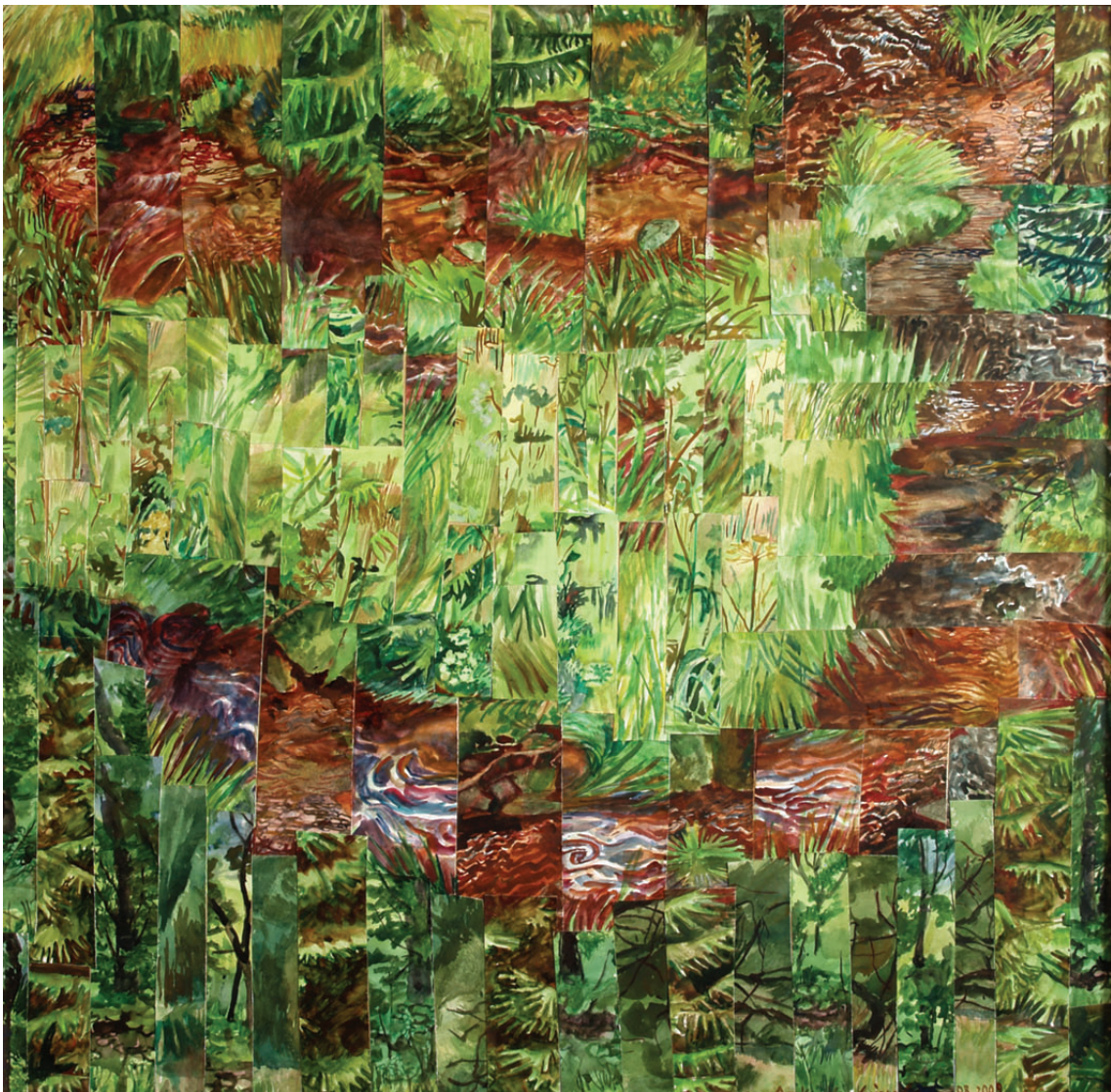
„Droga do środka 12” kolaż, 90 x 90 cm – 2010