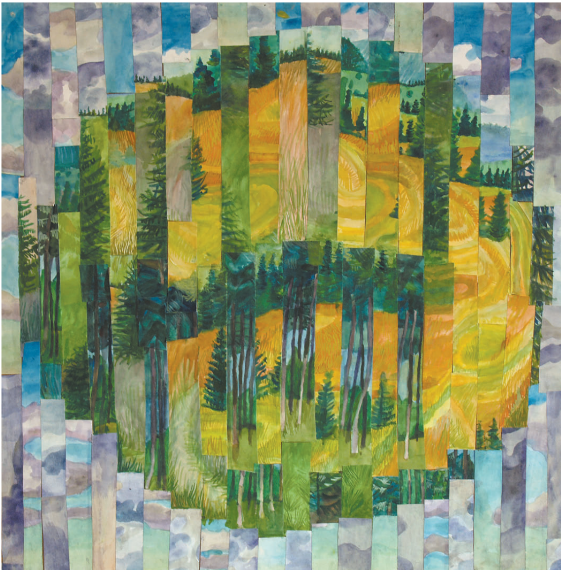
„Droga do środka 1” kolaż, 90 × 90 cm – 2008