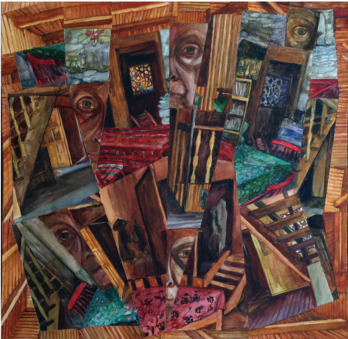
„Droga do środka 25” kolaż, 90 x 90 cm – 2012