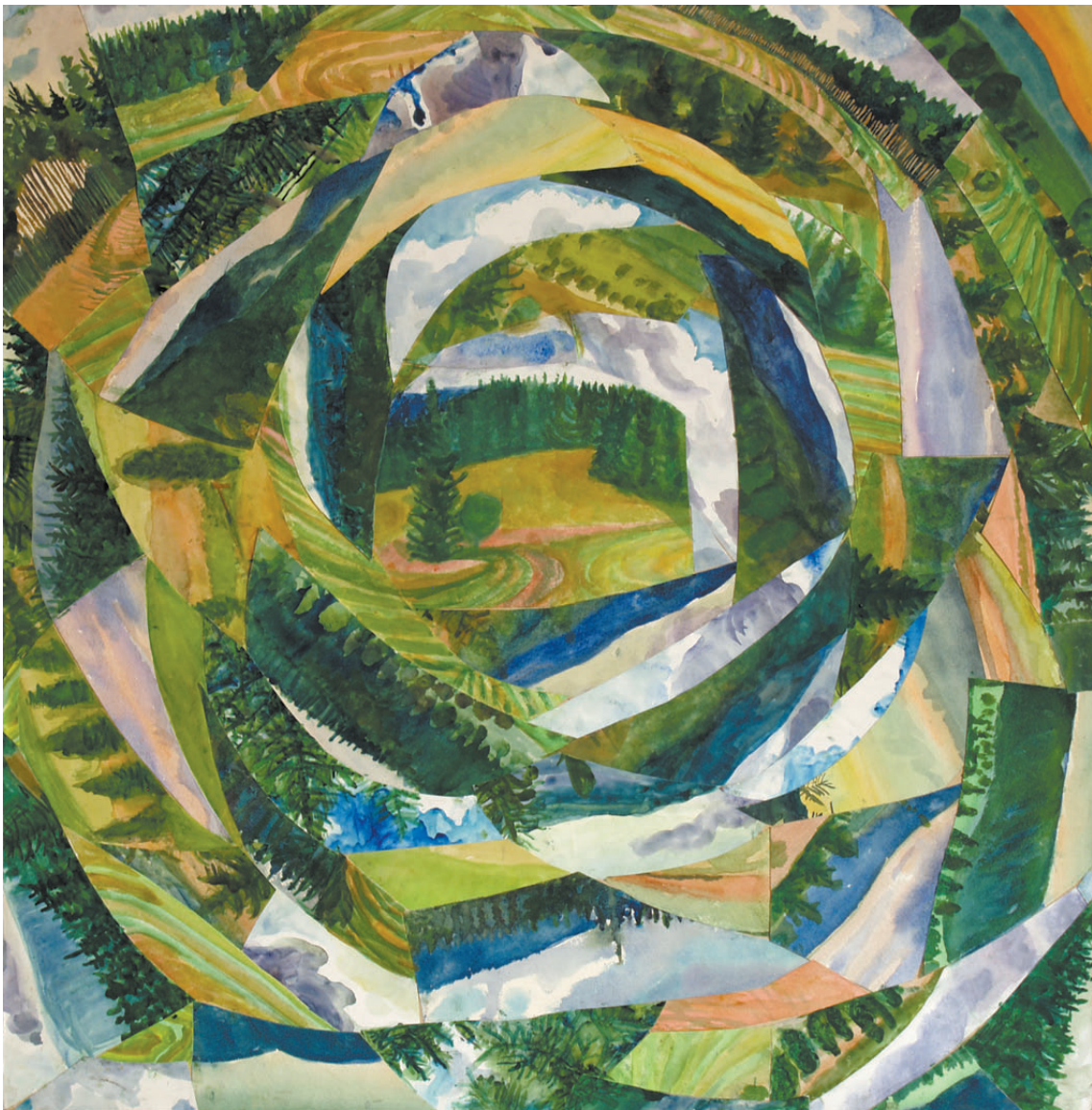
„Droga do środka 2” kolaż, 90 × 90 cm – 2008