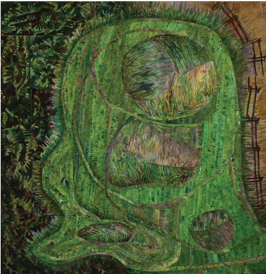
„Droga do środka 19” kolaż, 90 × 90 cm – 2011