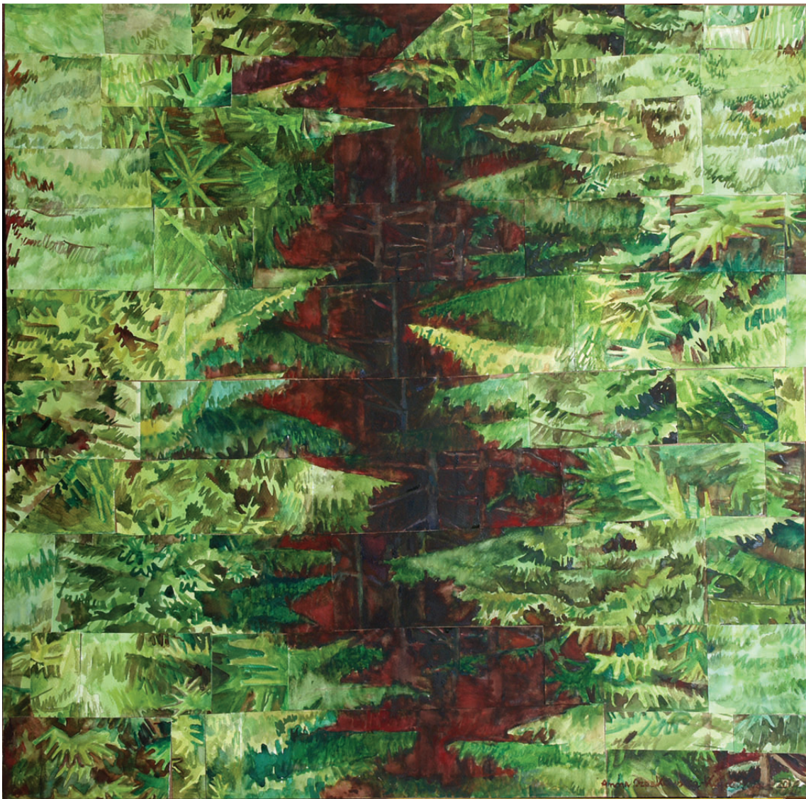
„Droga do środka 23” kolaż, 90 x 90 cm – 2012