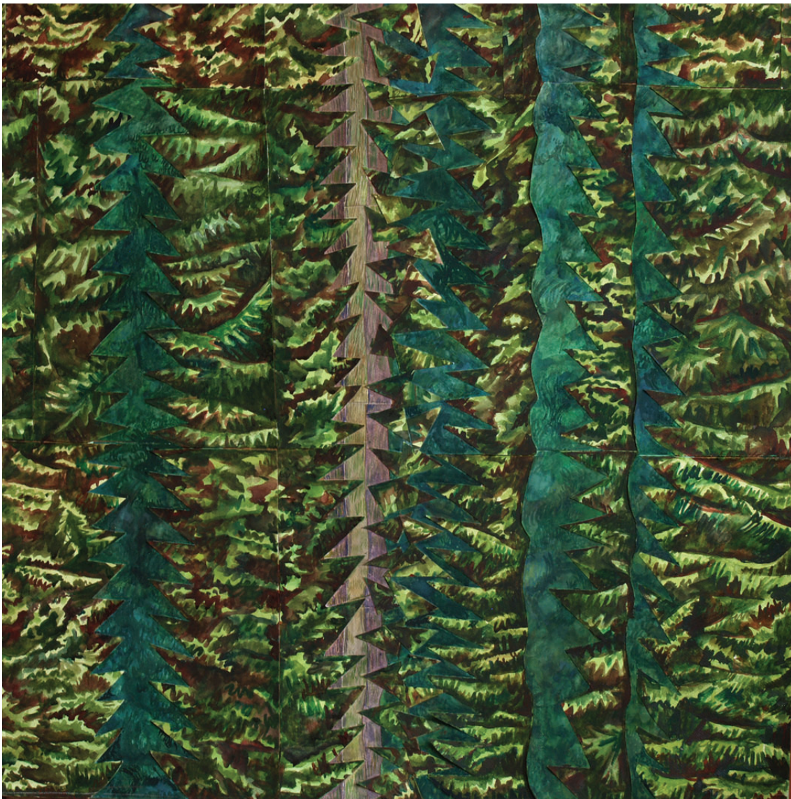
„Droga do środka 20” kolaż, 90 x 90 cm – 2011