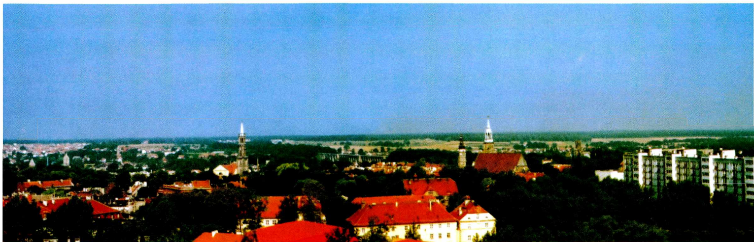
Rys. 3. Panorama Bolesławca Fig. 3. Panorama of Bolesławiec