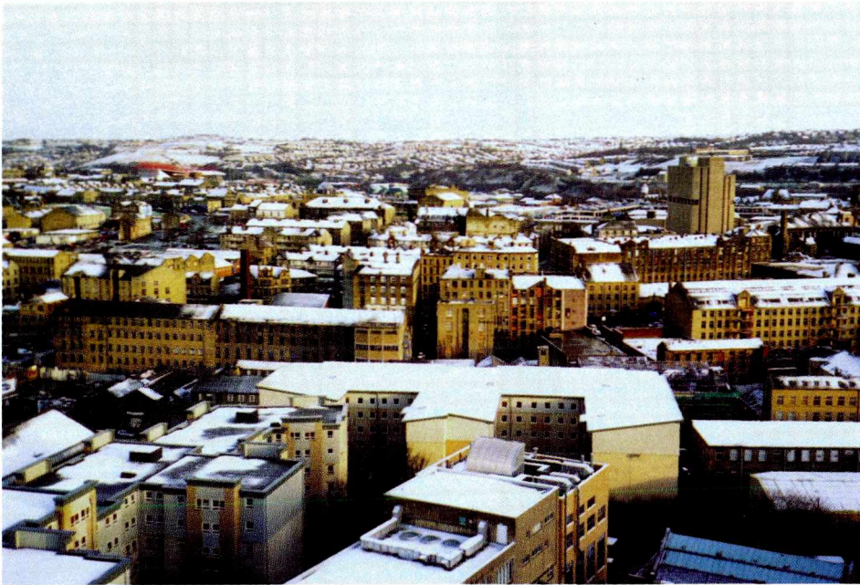
Ryc. 1. Zdegradowany krajobraz (widok z okna Uniwersytetu)