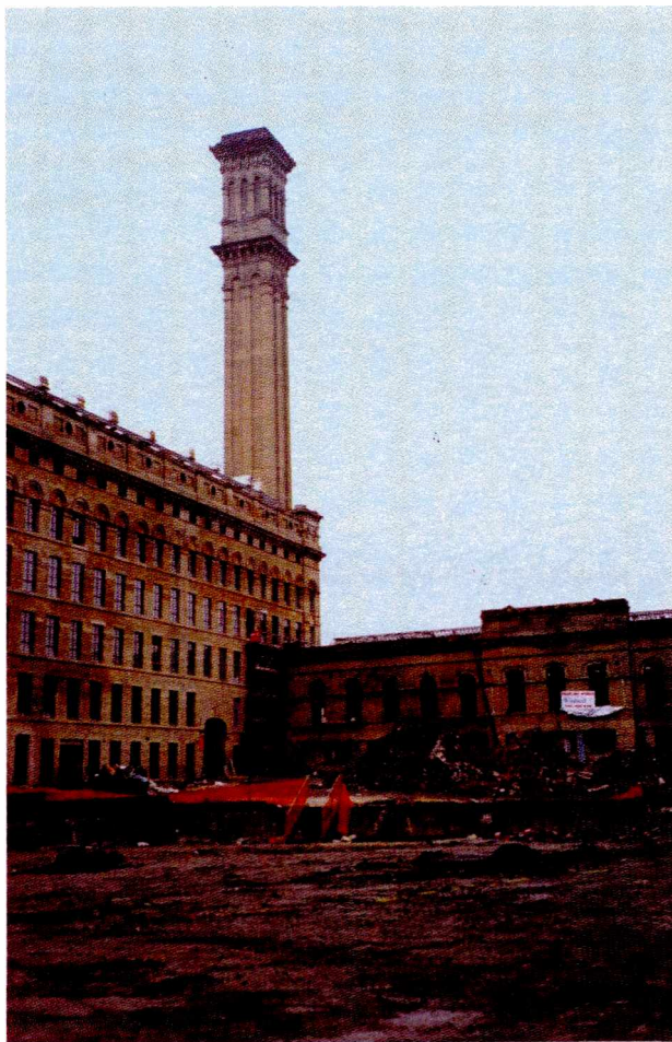
Ryc. 3. Fabryka Lister Mills w trakcie przebudowy Fig. 3. The Lister Mills factory during rebuilding

Dokumenty polityki regionalnej w Yorkshire and the Humber poświęcają wiele miejsca problematyce regeneracji miast. Regionalna Strategia Przestrzenna ( Regional Spatial Strategy ) postuluje odzyskiwanie zdegradowanych i niewykorzystanych obszarów i przeznaczanie ich na zabudowę mieszkaniową wysokiej intensywności, na obszary o funkcjach mieszanych (w pobliżu centrów miast i w miejscach o dobrej dostępności komunikacyjnej) lub na otwarte przestrzenie rekreacyjne. W odpowiednim zagospodarowaniu obszarów poprzemysłowych upatruje się także szansy na zapobieganie dalszej dyspersji zabudowy miejskiej i zmniejszenie konieczności długich codziennych dojazdów [3].