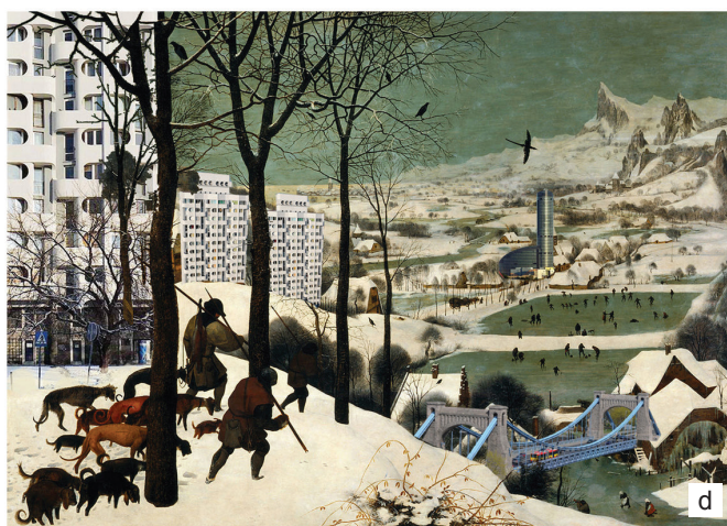
Il. 1. Wrocław w kolażach autorstwa: a) Ewy Tomczyk, b) Jerzego Głuszaka, c) Natalii Pośnik, d) Ewy Tomczyk