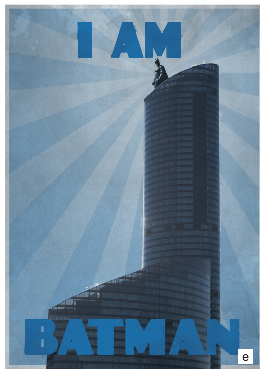
II. 3. Wrocław w kolażach autorstwa: