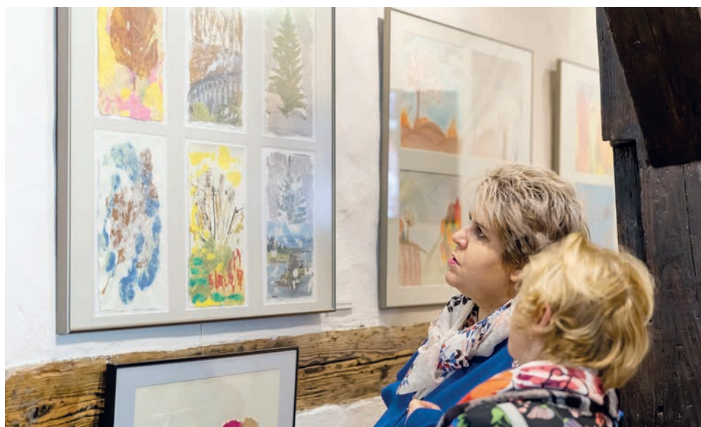
Oprac. na podst. materiałów Muzeum Papiernictwa, fot. Krzysztof Jankowski.