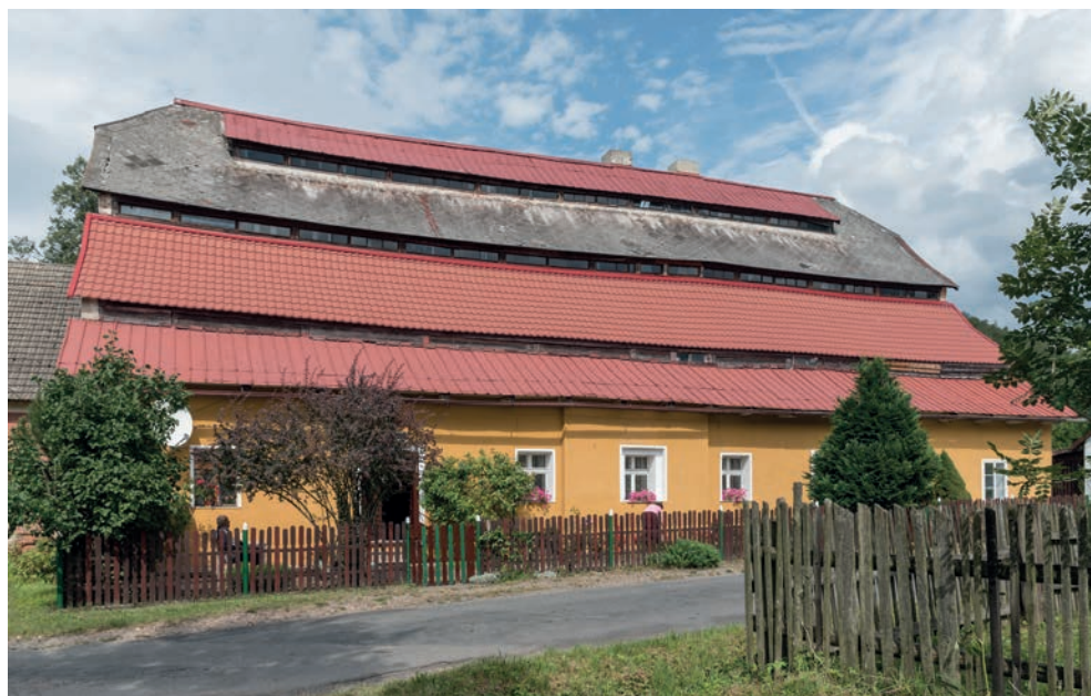
3. Dawna papiernia w Goworowie. Widok z 2017 roku.

Goworów jest jedną z najstarszych i zarazem największych wsi w południowej części ziemi kłodzkiej. Już w XVIII wieku miejscowość stała się dużym ośrodkiem tkactwa. Dalszy rozwój miejscowego przemysłu nastąpił w XIX stuleciu. Oprócz papierni działało tu sześć młynów wodnych, dwie olejarnie, dwa folusze, dwa tartaki i liczne warsztaty tkackie 38 .