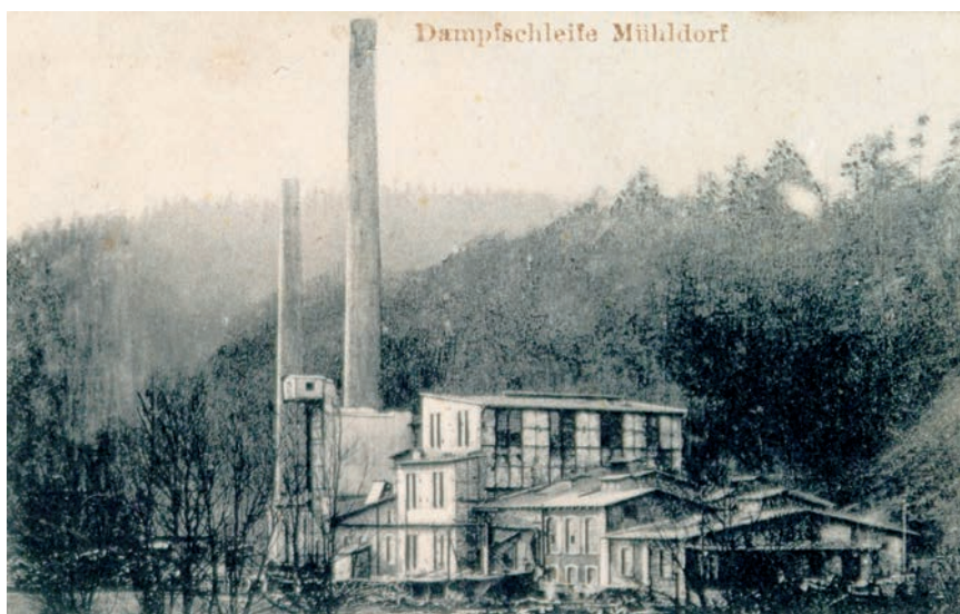
8. Ścieralnia w Ścinawicy. Widok sprzed I wojny światowej. Fragment widokówki ze zbiorów Muzeum Ziemi Kłodzkiej, sygn. MZK-V-3447

Ścinawica jest małą miejscowością sąsiadującą z Młynowem, w którym w 1884 roku powstała fabryka papieru. W związku z jej rozbudową znacznie wzrosło zapotrzebowanie na ścier. Z tego powodu firma Papierfabrik Mühlendorf GmbH w 1894 roku przystąpiła do budowy wielkiej nowoczesnej ścieralni w Ścinawicy. W zakładzie zainstalowano dwa ciągi do produkcji ścieru, dostarczone przez fabrykę maszyn z Chemnitz, które uruchomiono na początku następnego roku 210 . Według wykazu z połowy lat 30. XX wieku ścinawicki zakład dysponował aż siedmioma ścierakami, z których trzy były urządzeniami wysokowydajnymi 211 . Ścieralnia w Ścinawicy była największym zakładem przetwarzającym drewno na ścier na ziemi kłodzkiej.