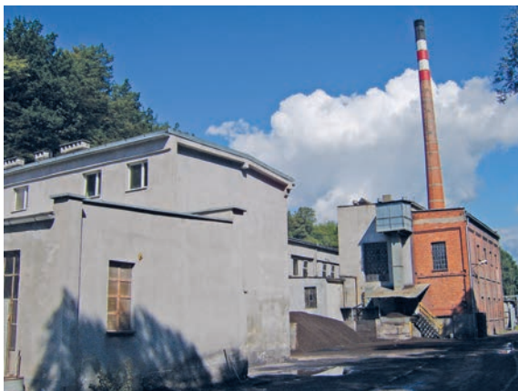
5. Fabryka papieru w Nowej Bystrzycy. Widok z 2010 roku.