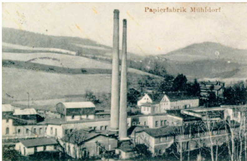
6. Papiernia w Młynowie. Widok sprzed I wojny światowej. Fragment widokówki ze zbiorów Muzeum Ziemi Kłodzkiej, sygn. MZK-V-3447