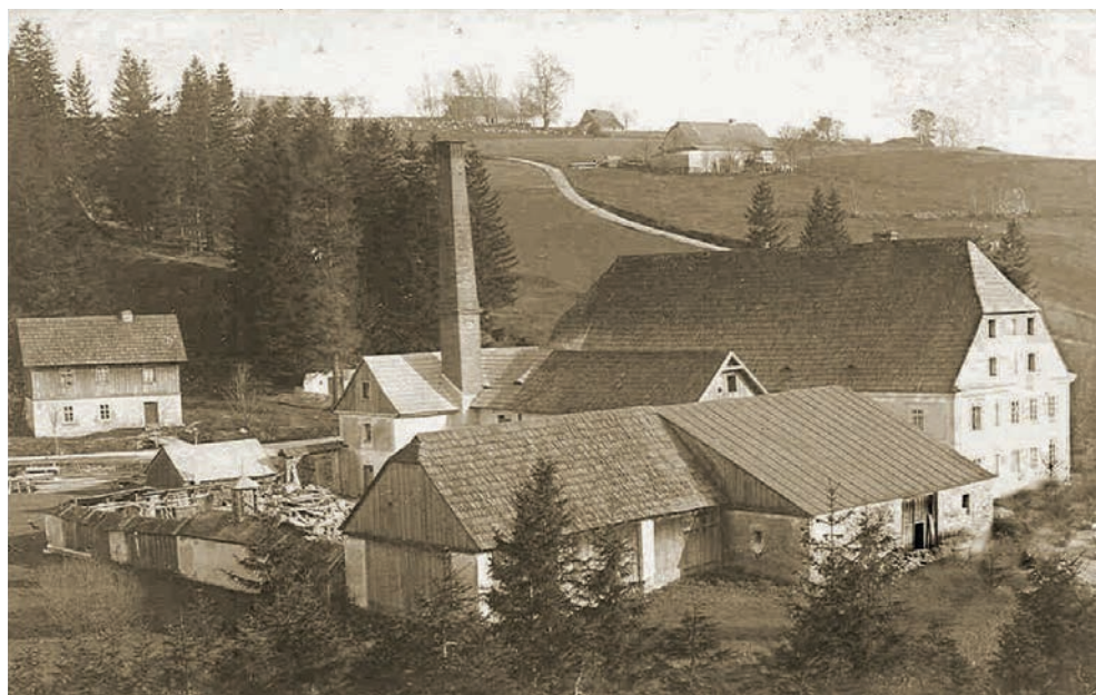
4. Zabudowania po papierni w Piaskowicach. Widok z 1909 roku.