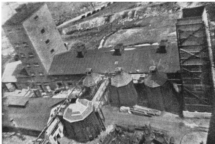
7. Zakłady celulozowo-papiernicze w Bardzie. Widok na spirytusownię.

wał Leopold Schoeller. Fabrykę uruchomiono w 1889 roku. Prowadzona była przez spółkę z ograniczoną odpowiedzialnością, posiadającą kapitał 600 tys. marek 195 . Początkowo wykorzystywano tam trzy, a nieco później cztery warniki służące do gotowania drewna na masę celulozową 196 . Pozyskiwanej tu masy nie poddawano wybielaniu, gdyż przeznaczona była do produkcji papierów pakowych. Odwadniano ją na dostarczonej przez firmę Füllner odwadniarce, o szerokości brutto 1,97 m 197 . Według zestawienia z 1925 roku w zakładzie eksploatowano pięć warników do produkcji celulozy, wytwarzających dziennie około 30 t celulozy siarczynowej 198 . W opracowaniu z 1927 roku wymieniono dwie odwadniarki oraz maszynę papierniczą o szerokości 1,5 m 199 , zatem część masy celulozowej przetwarzano w Bardzie na papier. Przed II wojną światową produkowano tu około 15 tys. ton celulozy rocznie 200 .