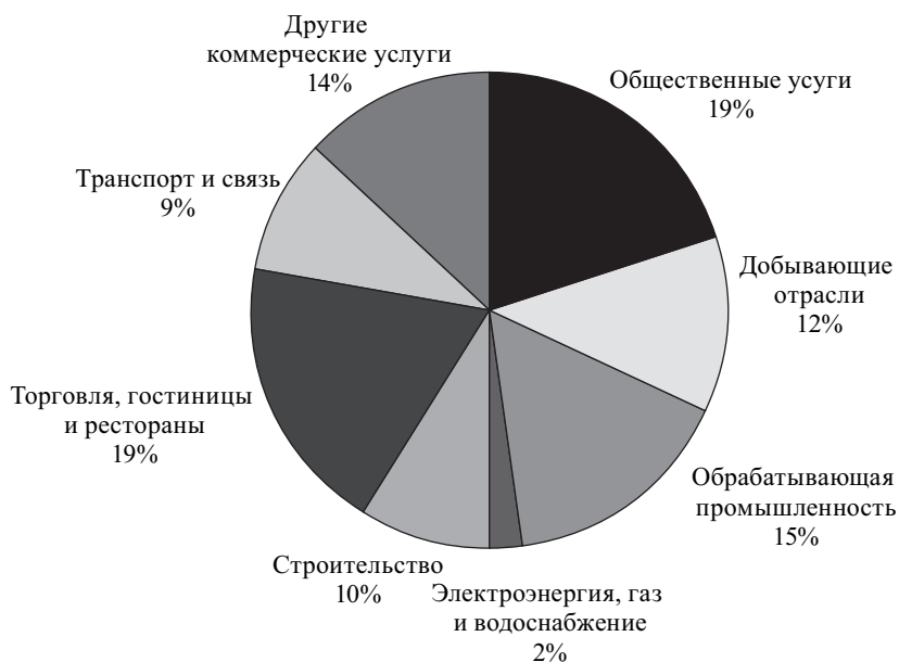
Рис. 4. Структура работающих по отраслям народного хозяйства Латвии (%), 2006 г.