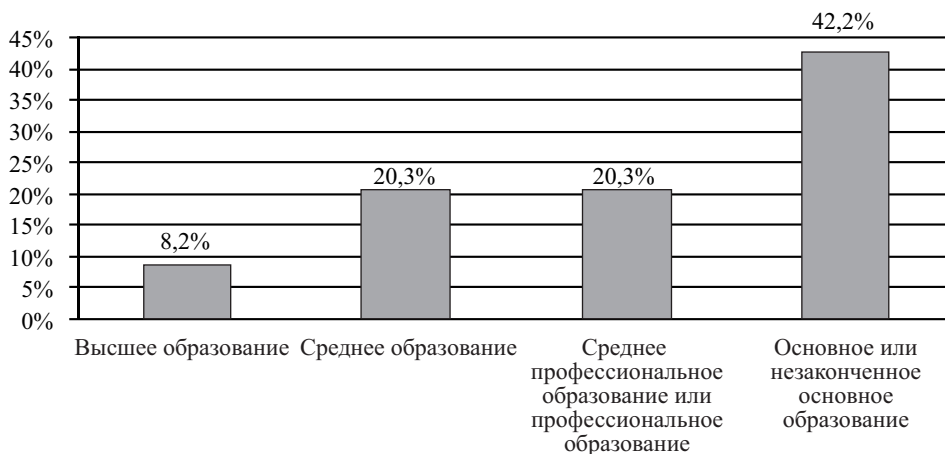
Рис. 2. Структура экономически активного населения Латвии по уровню образования в 2006 г.

Анализ структуры занятого в народном хозяйстве населения Латвии показывает, что на начало 2006 года у 8,2% есть высшее образование, 20,3% имеют среднее образование, 20,3% – среднее профессиональное образование или профессиональное образование, а 42,2% работающего населения имеет только основное или незаконченное основное образование.