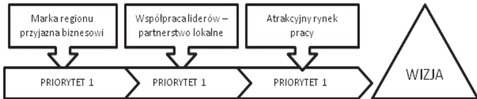
Rys. 3. Priorytety zmiany gospodarczej regionu szczecińskiego

stworzenia atrakcyjnych warunków do życia dla mieszkańców regionu”. Na rysunku 2 przedstawiono poszczególne priorytety w ramach obszarów działania łączące się w celu realizacji opisanej wizji. Po ich przedstawieniu poddane będą analizie pod kątem wpływu na innowacyjność regionu szczecińskiego.