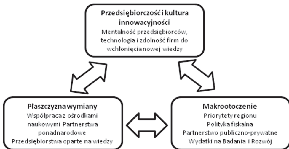
Rys. 1. Główne przesłanki innowacyjności przedsiębiorstw na poziomie makroekonomicznym

Aktualnie mówi się o interaktywnym procesie innowacyjnym, wykorzystującym wewnętrzne i zewnętrzne źródła innowacji. Wynika on z nagromadzenia niezbędnej dla przedsiębiorstwa wiedzy oraz oznacza zdolność do stałego uczenia się, jak umiejętnie dysponować zasobami.