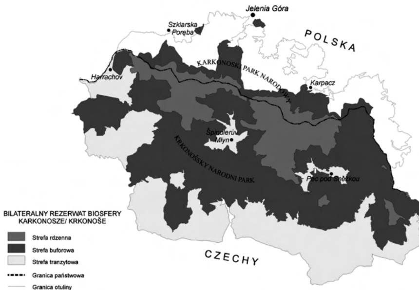
Rys. 1. Bilateralny Rezerwat Biosfery Karkonosze – teren KPN i KRNAP

Podstawową funkcją, jaką realizują parki narodowe, jest ochrona przyrody. Funkcja ta niejako zmusza do całościowego postrzegania przestrzeni KPN i KRNAP oraz współpracy przy zarządzaniu obszarem obu parków. Proces ten ułatwia sposób, w jaki ustawodawcy obu krajów określili zasady funkcjonowania parków narodowych – w najistotniejszych kwestiach nie ma różnic pomiędzy polskimi i czeskimi parkami narodowymi. W obu przypadkach parkiem narodowym kieruje – wybierany na podstawie konkursu ogłaszanego przez właściwe ministerstwo ds. środowiska – dyrektor parku. Istotna jest również spójność dotycząca źródła finansowania działalności omawianych jednostek: w obu przypadkach ustawodawca zapewnia środki budżetowe – z danych zarówno KPN, jak i KRNAP wynika, że nie są to środki zapewniające pokrycie wszystkich kosztów. Można ten fakt oceniać negatywnie, niemniej jednak szczupłość środków budżetowych jest silnym bodźcem zmuszającym parki do poszukiwania alternatywnych źródeł finansowania, a więc pośrednio jest jednym z czynników mobilizujących do realizowania unijnych projektów transgranicznych. Kolejną wspólną cechą omawianych podmiotów jest organ doradczy w formie tzw. Rady Naukowej, w skład której wchodzi nie tylko przyrodnicy, ale i przedstawiciele lokalnych samorządów reprezentujących interesy i poglądy lokal-