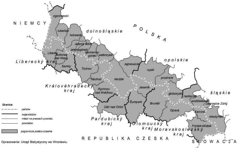
Rys. 1. Pogranicze polsko-czeskie