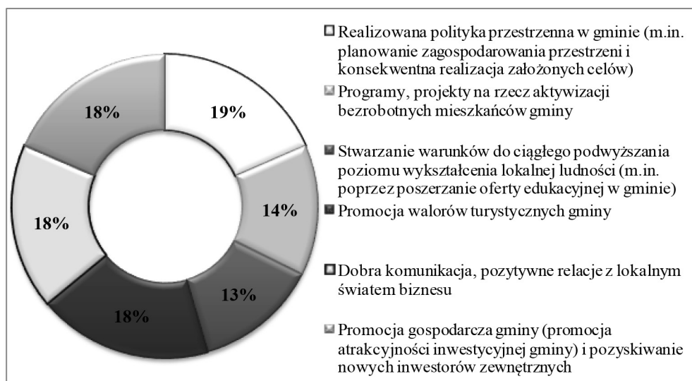
Rys. 2. Ocena wpływu podejmowanych działań na zrównoważony rozwój gminy