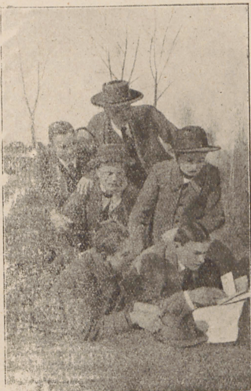
Одно з перших тайних військових товариств українських студентів університету в Галичині. — (Ф. Фель-Черняк).

Англійська ідея пласту (скавтіngu) й глухі вістки про тайні польські військові організації показали цій галицькій українській молоді, як слід організувати збройну силу. Так-то спершу серед гімназійної, швидко потім і університетської української молоді у Львові закладаються перші українські тайні військові товариства. Ідея революційного українського війська, що підніме боротьбу за недосягну, як недавно видавалося, мрію — українську державність — швидко захоплює чим-