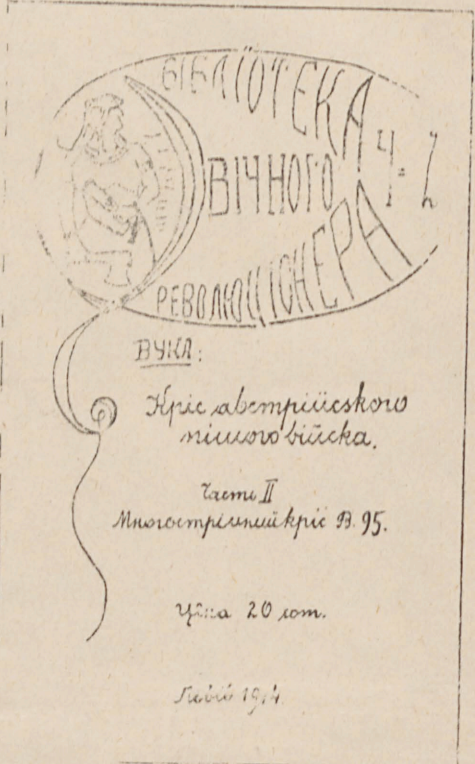
Перше українське військове товариство. (Один із підручників, виданих „Мазепинським Курсом Мілітарним“ на переломі 1913 і 1914. р.)

Стрільці II“ у Львові стали незвичайно популярні серед українського львівського міщанства й робітництва, що гуртувалися у львівській „Січі“, й швидко в них зібралось кілька сотень членів. Рівночасно з великим розмахом організувалися у всій