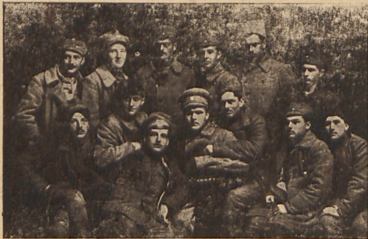
Одні з перших Січових Стрільців.

Проти полонених Українських Січових Стрільців і дрібної частини других полонених Галичан, що пішли з ними, скрізь по таборах рушив „одностайним фронтом“