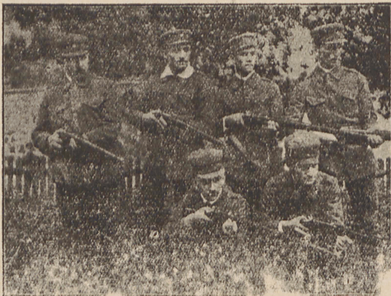
Одна з перших явних українських військових організацій у Галичині.

І так у всій Галичині наприкінці 1913. року товариство „Січ“ а за ним подібне українське товариство „Сокіл“ почали формувати свої відділи „Січових“ і „Сокільських“ „Стрільців“, щоби військовими заняттями зацікавити своїх членів. У всій