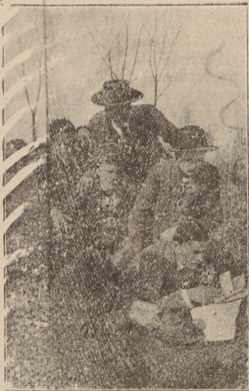
Одно з перших тайних військових товариств українських студентів університету в Галичині. — (Федь Черник)

Англійська ідея пласту (скавтіngu) й глухі вистки про тайні польські військові організації показали цій галицькій українській молоді, як слід організувати збройну силу. Так-то спершу серед гімназійної, швидко потім і університетської української молоді у Львові закладаються перші українські тайні військові товариства. Ідея революційного українського війська, що підніме боротьбу за недосягну, як недавно видавалося, мрію — українську державність — швидко захоплює чим-